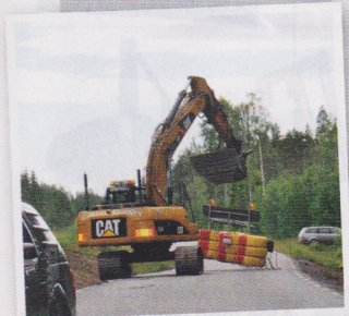
En och annan Cat har smugit sig in bland övervägande Volvo-maskiner.

På vägen dit har Svevia ett vägförstärkningsarbete och där står flera maskiner. NCC bygger nytt på bestadsområdet Ålidhem, och Sundhs står för markplaneringen. Några lastbilar kör massor till bygget an