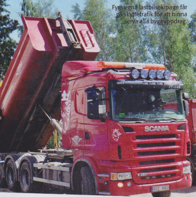
Fyra egna lastbilskeppage får gå skyttetrafik för att hinna serva alla bygguppdrag.